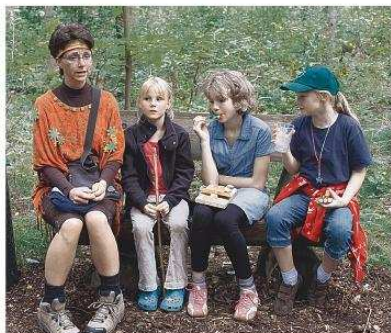
Aufmerksame Zuhörer: Die Waldfee erzählte den Kindern Geschichten.